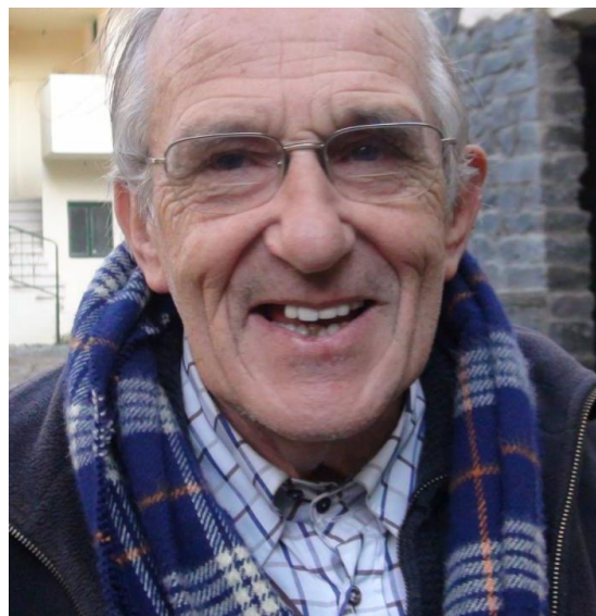
Pater Frans van der Lugt SJ

De vastenactie is een actie om hulp te verlenen aan noodlijdende gebieden in de wereld. Met een gevoel van solidariteit met de mensen die in erbarmelijke omstandigheden moeten leven en zonder uitzicht op een betere toekomst, willen we voor hen iets kunnen betekenen. In erbarmelijke omstandigheden zorgde pater Frans voor zijn geliefde Syriërs, voor de bejaarden en gehandicapten en gewonde bewoners uit Homs die niet konden vluchten.