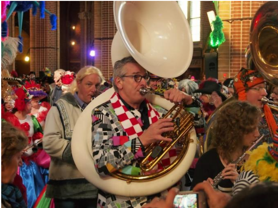
Sfeerbeeld uit de Carnavalsmis van 2014

Omdat lang niet alle vaste kerkbezoekers naar deze mis zullen gaan, bieden we u op de vroege zaterdagavond om 17.00 uur een 'zondagse mis' aan.